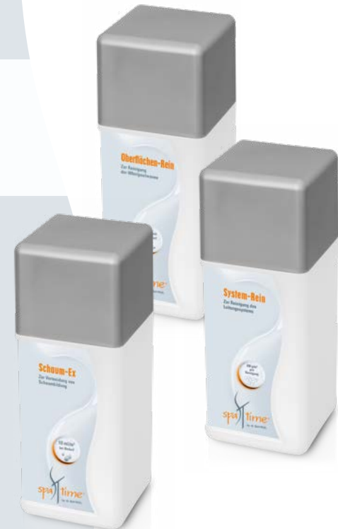
Oberflächen-Rein System-Rein Schaum-Ex

Schaum auf der Wasseroberfläche sieht nicht sehr einladend aus. Falls Ihr Whirlpoolwasser zur Schaumbildung neigt, empfehlen wir Ihnen die Zugabe von Schaum-Ex . Die Dosierung erfolgt direkt ins Whirlpoolwasser. Schäumt das Wasser nach der Zugabe immer noch, sollte es gewechselt werden.