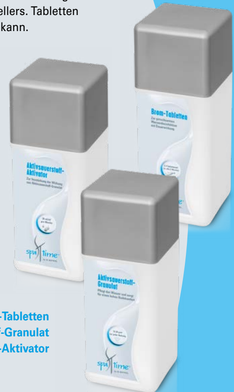
Brom-Tabletten Aktivsauerstoff-Granulat Aktivsauerstoff-Aktivator

Für eine Komplettpflege muss zusätzlich zu Aktivsauerstoff-Granulat einmal wöchentlich Wasser-Rein verwendet werden.